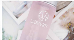
① 角質層にす〜と浸透

LIOVERITEは、普段の忙しさや、考えることから開放され「ほっとする」ように「肌も心も自分を取り戻す」をコンセプトにしたスキンケアブランドです。日常から離れて過ごす旅、いつもとは違うゆったり過ごすTHE KNOTの特別な空間に「ほっとする」スキンケアタイムをお届けします。