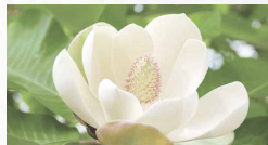
③ こだわりの香りで心もリラックス